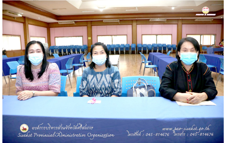
องค์การบริหารส่วนจังหวัดศรีสะเกษ Sisaket Provincial Administrative Organization

วัตถุประสงค์เพื่อให้หน่วยงานภายในได้สังกัดสามารถเรียนรู้แนวทางการบันทึกบัญชีและการจัดทำรายงานการเงินแบบใหม่ ตามมาตรฐานการบัญชีภาครัฐที่เริ่มใช้ในปีงบประมาณ พ.ศ. 2564 เป็นต้นไปด้วยความถูกต้อง เป็นมาตรฐานเดียวกัน และเพื่อเตรียมรองรับการตรวจสอบของสำนักงานการตรวจเงินแผ่นดินต่อไป โดยการประชุมแบ่งออกเป็น 5 ครั้ง มีผู้เข้าร่วมประชุมครั้งละไม่เกิน 30 คน ดำเนินการภายใต้แนวปฏิบัติตามมาตรฐานด้านสาธารณสุขการป้องกันโรคติดเชื้อไวรัสโคโรนา 2019 หรือโรคโควิด - 19 ณ ศูนย์แสดงและจำหน่ายสินค้าหนึ่งตำบลหนึ่งผลิตภัณฑ์ (OTOP) องค์การบริหารส่วนจังหวัดศรีสะเกษ