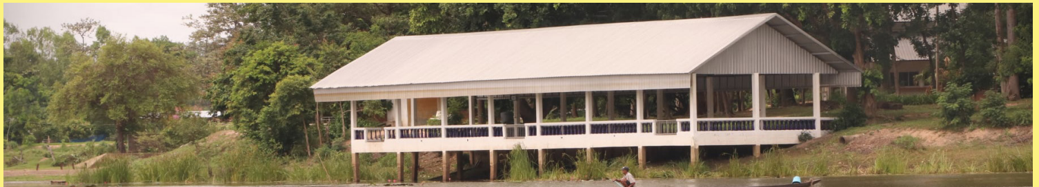
www.pao-sisaket.go.th โทรศัพท์ : 045-814676 โทรสาร : 045-814676